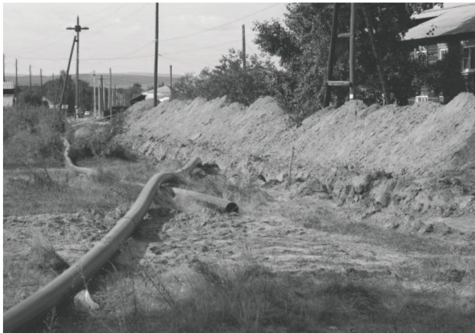
подавать документы на вступление в программу.

Далее, при утверждении ТЭО, будет разработан проект, с оценкой его в денежном эквиваленте, госэкспертиза, а при наличии положительного заключения можно будет