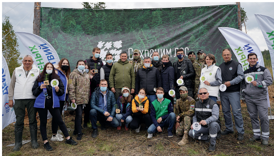
В посадке леса в Хомутовском лесничестве приняли участие 150 добровольцев

Губернатор подчеркнул, что восстановление лесов должно быть стратегическим направлением. Для этого в регионе будут по-